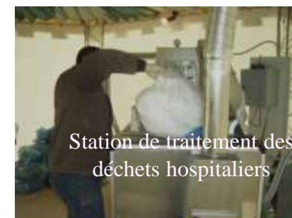
Station de traitement des déchets hospitaliers