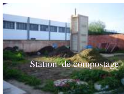
Station de compostage