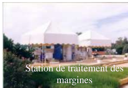
Station de traitement des marginés

Des Stations Pilotes Pour Illustrations Pratiques