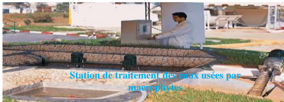
Station de traitement des eaux usées par macrophytes