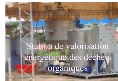
Station de valorisation énergétique des déchets organiques